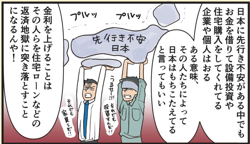
※全期間固定金利型の場合の金利は変わりません。